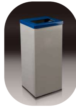
UN CUBO RECTANGULAR CON TAPA ABATIBLE Y ARO SUJETA-BOLSAS PARA SELECCIÓN RECOGIDA 70L