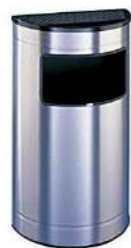
CENICERO PAPELERA MEDIA LUNA 50L