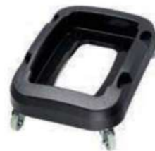
BASE CON RUEDAS PARA PAPELERA RECICLAJE 60L

Tapa Azul AF07333B Tapa Amarilla AF07333B Tapa Roja AF07333B Tapa Verde AF07333B