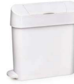
22L PEDAL SANIBIN