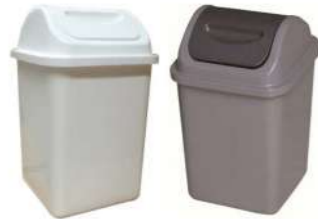
10L TAPA VAIVÉN