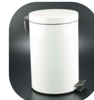
PAPELERA CON PEDAL