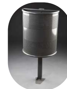
PERFORADA SEMICIRCULAR CON FIJACIÓN PARED Y ARO SUJETABOLSAS 90L