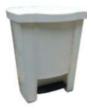
18L BLANCA CON PEDAL Y CUBO INTERIOR