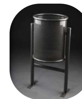
PERFORADA CIRCULAR SUELO METÁLICO PINTADA 60L