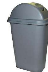
CURVA GRIS 35L