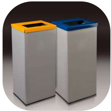
RECTANGULAR CON TAPA ABATIBLE Y ARO SUJETA-BOLSAS PARA SELECCIÓN RECOGIDA