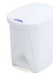
7L CON PEDAL