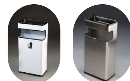
CENICERO PAPELERA RECTANGULAR 40L

Metálica pintada* 13001082 Satinada 13001084