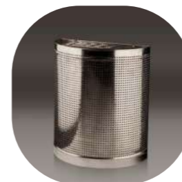
PERFORADA SEMICIRCULAR PARED ACERO INOX 45L