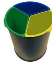
15L METÁLICA 3 CUBOS COLORES