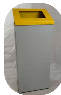
1 CUBO RECTANGULAR CON TAPA ABATIBLE Y ARO SUJETA-BOLSAS PARA SELECCIÓN RECOGIDA CON TAPA INCLINADA ANTI-DEPÓSITO 70L