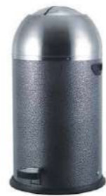
ACERO PINTADO 33L