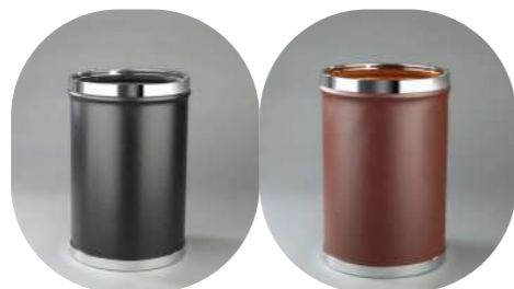
REDONDA PEQUEÑA DOBLE CUERPO FORRADA POLIÉPIEL 10L