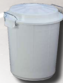
CUBO INDUSTRIAL 50L 040083.3