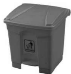
CUBO + PEDAL S/TAPA