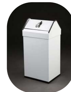
CABEZAL BASCULANTE 40L