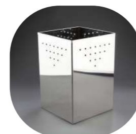
INOX BRILLO HABITACIÓN Y BAÑO CON CUBO INTERIOR