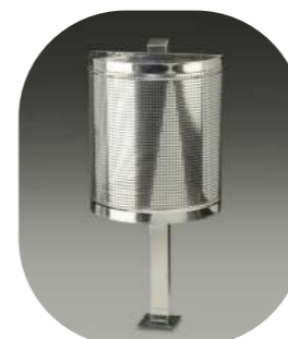
PERFORADA SEMICIRCULAR SUELO METÁLICA PINTADA 45L