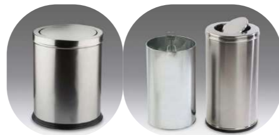
REDONDA INOX CON CABEZAL Y BASCULANTE

10L 13001250 14L 13001252 40L 13001254 80L 13001256