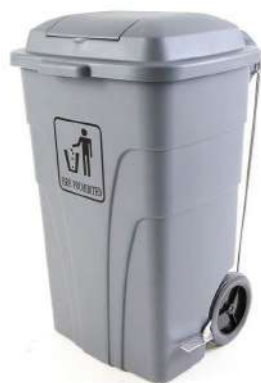
120L PEDAL + TAPA