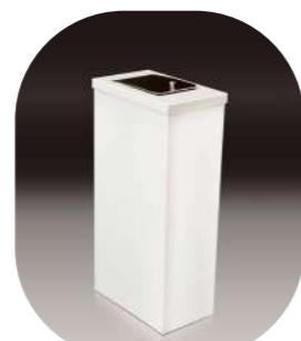
COMPRESERA METÁLICA BALANCÍN INOX