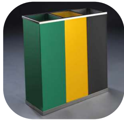
PAPELERA CLASIFICACIÓN 3 CUBOS PINTADOS