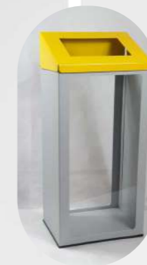
RECTANGULAR CON VENTANA FRONTAL Y TRASERA PARA ACCESO VISUAL (MODELO SEGURIDAD AEROPORTUARIA), ARO SUJETA-BOLSAS Y TAPA COLOR RECICLAJE CON TAPA INCLINADA ANTI-DEPOSITO 70L