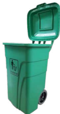
120L SIN PEDAL VERDE/AMARILLO