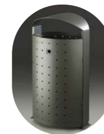
URBANA CON PUERTA FRONTAL 95L