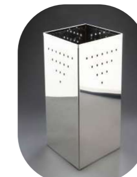
INOX BRILLO SALONES CON CUBO INTERIOR