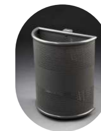
PERFORADA SEMICIRCULAR PARED METÁLICA PINTADA 45L