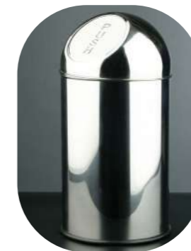
REDONDA CABEZAL PUSH 40L