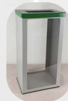
RECTANGULAR CON VENTANA FRONTAL Y TRASERA PARA ACCESO VISUAL (MODELO SEGURIDAD AEROPORTUARIA), ARO SUJETA-BOLSAS Y TAPA COLOR RECICLAJE