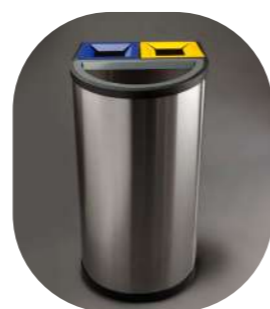
CLASIFICACIÓN INOX CON AROS SUJETA-BOLSAS