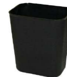
INIFUGA MARRÓN 14L