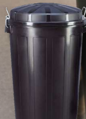
CUBO INDUSTRIAL 95L 040084.1