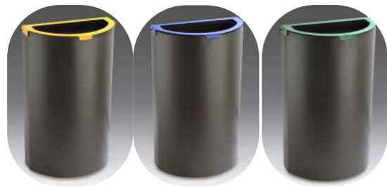
DE RECICLAJE CON CABEZAL DE COLOR IDENTIFICATIVO Y ARO SUJETA-BOLSAS 100L