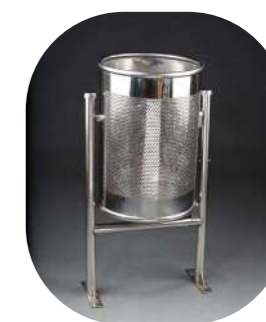
PERFORADA CIRCULAR SUELO INOX BRILLO 75L