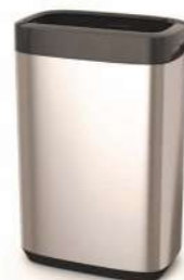
PAPELERA TORK BIN 50L