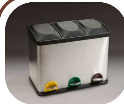
PEDAL 3 CUBOS