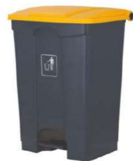
87L CUBO + PEDAL S/TAPA