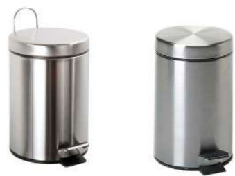
PAPELERA CON PEDAL