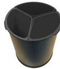
15L METÁLICA 3 CUBOS NEGROS