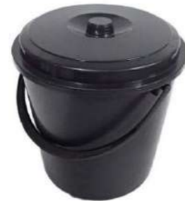
CUBO BASURA BIG BANG 16L 040098.2