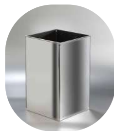
CUADRADA INOX 10L

10L 13001250 14L 13001252 40L 13001254 80L 13001256