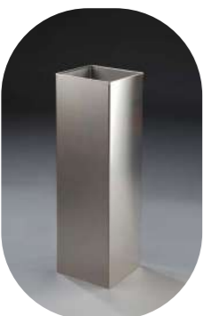
CUADRADA INOX 25L

Chapa pintada* 13001104 Satinada 13001102 Satinada con tapa 13001324