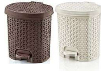
CON PEDAL RATTAN

Marrón 5,5L 050073.41 Crema 5,5L 050073.46 Marrón 21L 050073.42 Crema 21L