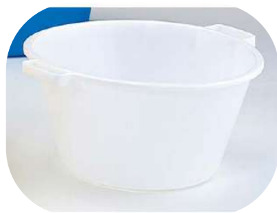
BARREÑO BLANCO 12L 040098.3