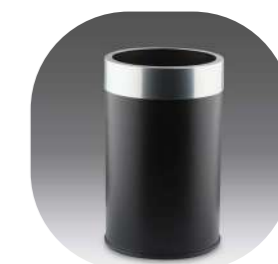
HABITACIÓN NEGRA CABEZAL SUJETABOLSAS CROMA 16L