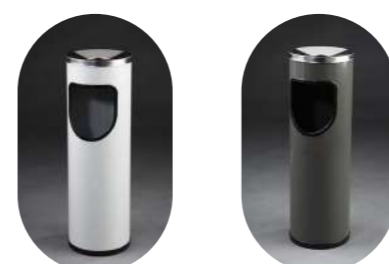
CENICERO PAPELERA REDONDA 20L

Metálica pintada* 13001074 Inox Satin 13001076