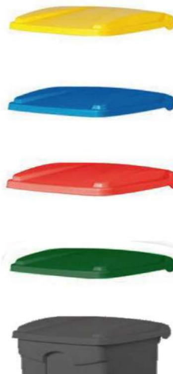
TAPA CONTENEDOR 30/45L