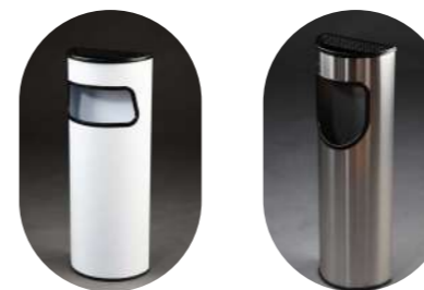
CENICERO PAPELERA SEMICIRCULAR 15L

Metálica pintada* 13001094 Satinada 13001096 Satinada con tapa ciega 13001322