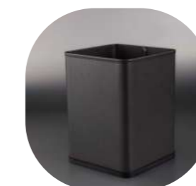
CHAPA PARA HABITACIÓN