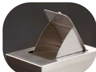
COMPRESERA BALANCÍN INOX