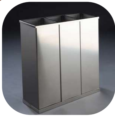
PAPELERA CLASIFICACIÓN 3 CUBOS INOX SATINADOS