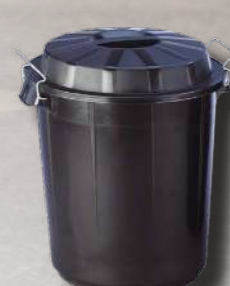
CUBO INDUSTRIAL 50L 040089