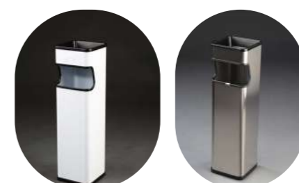
CENICERO PAPELERA CUADRADA 25L

Metálica pintada* 13001078 Satinada 13001080