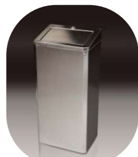
COMPRESERA INOX 430 35L