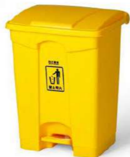
68L PEDAL + TAPA