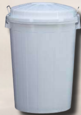
CUBO INDUSTRIAL 95L 040098.1