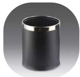
REDONDA PEQUEÑA DOBLE CUERPO PINTADA 10L