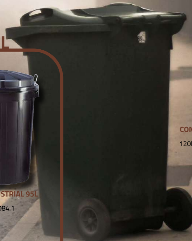
CONTENEDORES INDUSTRIAL 120L rueda+pedal 050073.98 1100L 050073.99