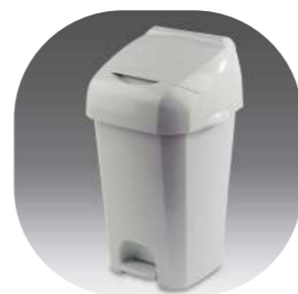
CONTENEDOR HIGIÉNICO PARA PAÑALES 50L