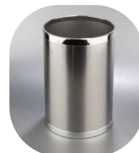
REDONDA INOX SATINADA 10L