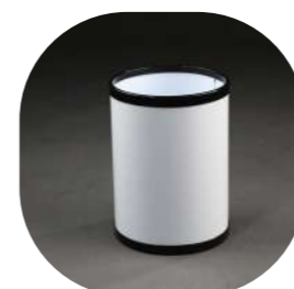
REDONDA METÁLICA PINTADA 10L