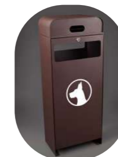
CON DISPENSADOR DE BOLSITAS PARA PERROS