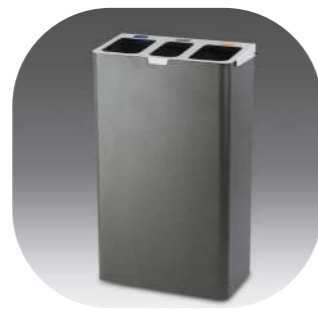
RECICLAJE TRES RESIDUOS CON AROS SUJETA-BOLSAS 33L+33L+33L