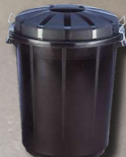
CUBO INDUSTRIAL 70L 040084.4