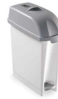
HIGIENICO FEMENINO DESY