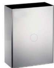
RECTANGULAR SATINADA 25L