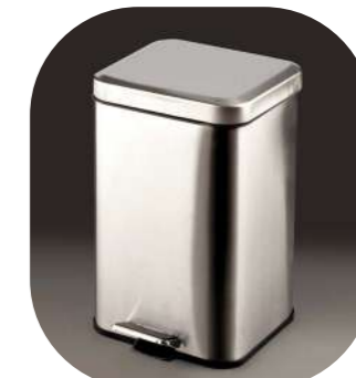
PAPELERA CON PEDAL