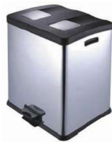
INOX RECICLADO 2x30L CON PEDAL