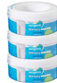
SANGENIC CARTUCHO PAÑALES UNIDAD