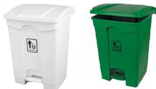
45L PEDAL + TAPA