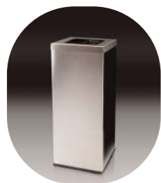
PASILLOS Y HOTELES INOX