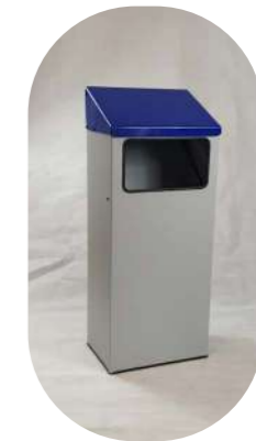
RECTANGULAR CON TAPA CIEGA INCLINADA ANTIDEPÓSITO Y BOCA FRONTAL, ARO SUJETABOLSAS Y TAPA COLOR RECICLAJE 70L