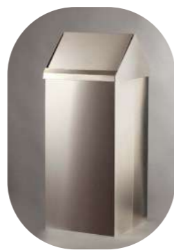
CABEZAL BASCULANTE INOX SATINADA